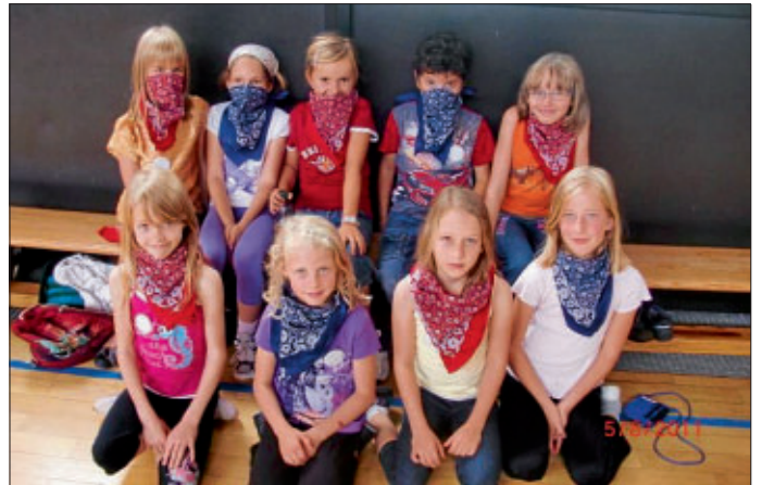
Beim Sommerferienprogramm "Line Dance" konnten die Kinder verschiedene Choreographien erlernen. Ein paar Kinder hatten anfangs leichte Probleme mit den Tänzen, doch am Schluss klappten die Schrittfolgen bei allen Kindern.

Die erste Woche der Sommerferien war bereits gespickt mit tollen Ferienprogrammepunkten. Obwohl die erste Veranstaltung - die Nachtwanderung - wetterbedingt ausfallen musste, waren die Kinder voller Eifer bei der Schluchtüberquerung, im Hochseilgarten, beim FerienKino, Line Dance und der Walderkundung dabei.