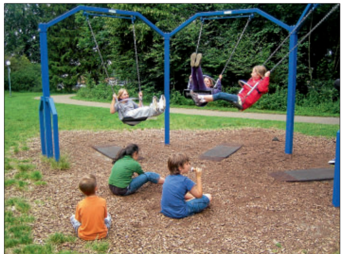
Im Hochseilgarten konnten die Kinder ihren Mut beweisen. Nach dem Klettern tobten sich die Kinder auf dem Spielplatz aus.