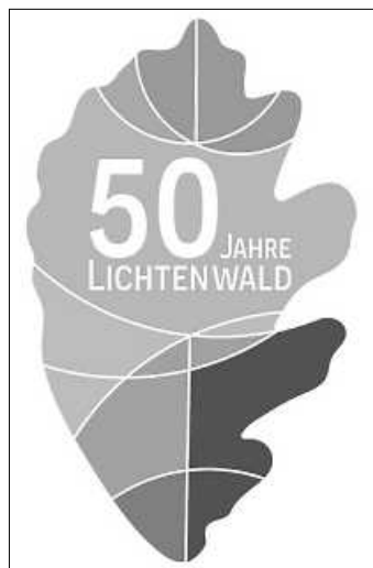
50 Jahre Lichtenwald