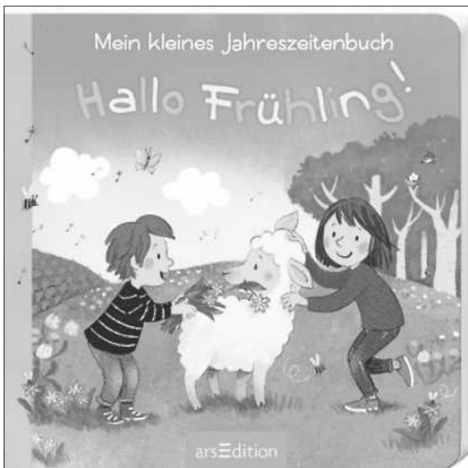
Jahreszeitenbuch für die Kleinsten