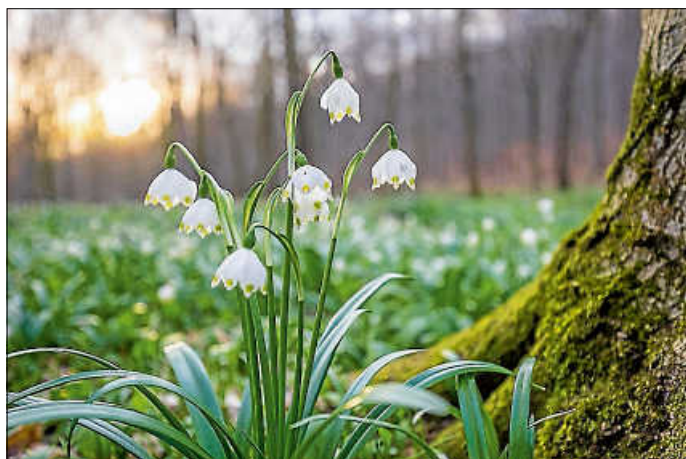
Märzenbecher - Frühlingsgruß