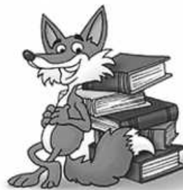
Einfache Büchersuche mit Findus Grafik: Findus