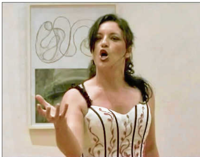
Constanze Seitz als Königin der Nacht