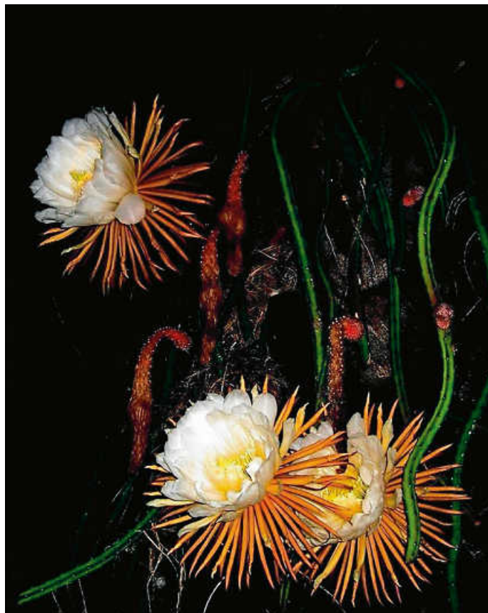
Königin der Nacht blüht in der Nacht

wird das Herz-Medikament „Tinctura Cacti“ hergestellt und neuerdings wird der Blütenduft auch in berühmten Parfums verwendet.