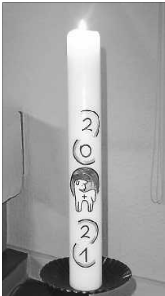
Osterkerze 2021

Am Ostersonntag wurde es bunt und bildlich. Denn diesmal zog ein modernes Auferstehungsbild im Altarraum unserer Auferstehungskirche die Blicke auf sich. In vielen leuchtenden, aber auch in