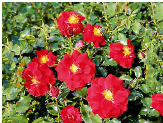
„Flammende Rose“ von G. F. Händel – Strauchrose