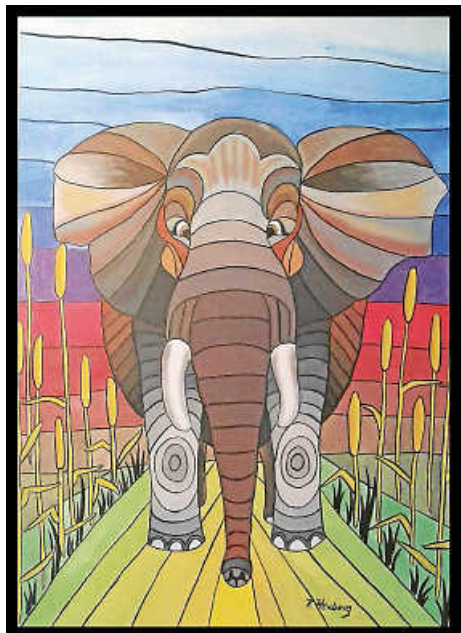
Künstlerin: Karin Heuberg