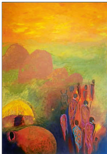
Künstlerin: Irmgard Kammermeyer