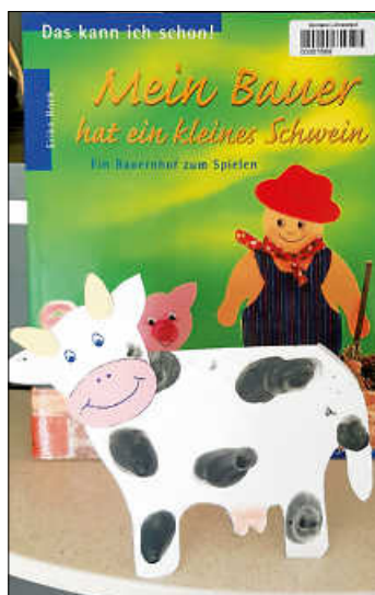
Bastelbuch mit gebastelter Kuh