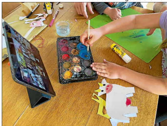
Super-Bastler am Werk!